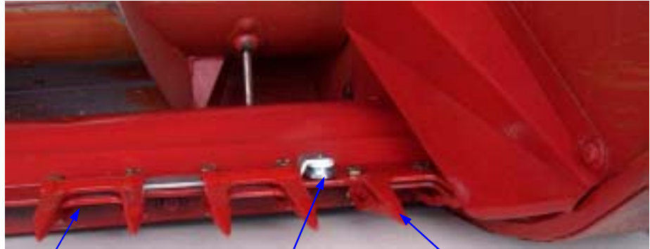
Linke Seite (Messerantrieb)